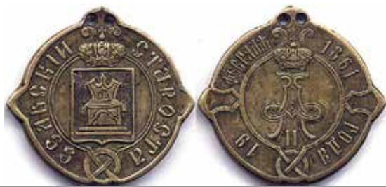
Такой знак в Тверской губернии выдавался сельскому старосте в XIX веке.