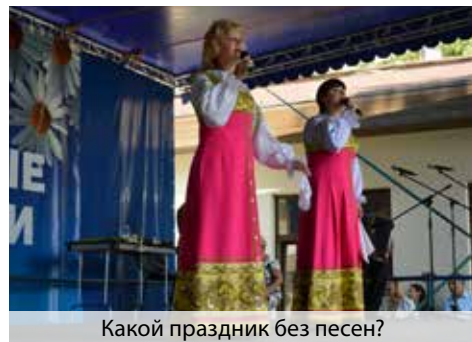
Какой праздник без песен?